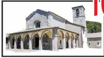
10 La Verna