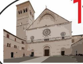
1 San Rufino