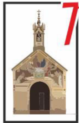
7 Porziuncola in Santa Maria degli Angeli