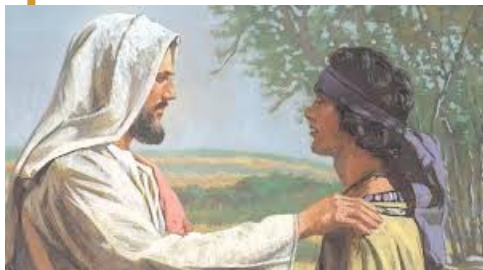
Fissatolo, lo amò Mc 10, 21